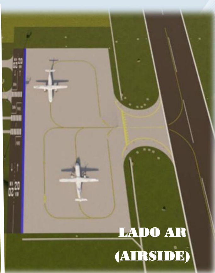
LADO AR (AIRSIDE)