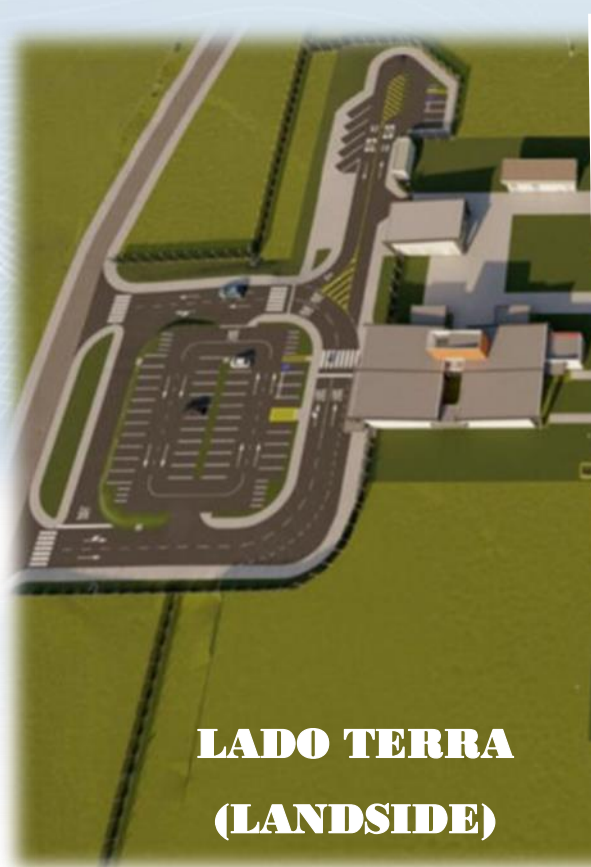
LADO TERRA (LANDSIDE)

O Lado Ar (AIRSIDE) constitui uma área de movimento restrito dado às características desse espaço. Nesta área existe um conjunto de infraestruturas de apoio e terrenos adjacentes (nomeadamente pistas, plataformas de estacionamento e caminhos de circulação) cujo acesso é controlado.